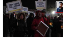
İhraç edilen doktora vebalı muamelesi