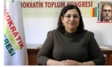
Annelerden Güven'e destek: 'Bu faşizm değil de nedir?'