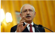
Kemal Kılıçdaroğlu'ndan 'Türkçe ezan'