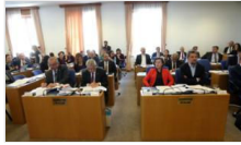
AKP'li vekil: Kadına karşı şiddette olumlu gelişmeler var