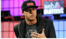
Teknoloji dünyasının yeni milyarderleri: Babalarının bodrum