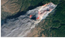
California'daki yangında can kaybı artıyor