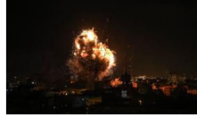
İsrail jetleri Gazze'de televizyon binasını vurdu