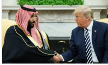
Trump'tan tepki çeken Suudi Arabistan paylaşımı