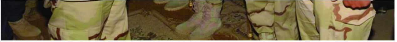
رئيس الأركان يتفقد تدريباً للجيش المصري