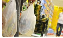
Enflasyonda en kötü henüz geride kalmadı