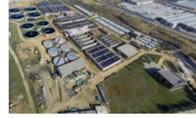
OSB'de 'izin' oyunu