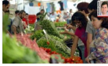
Yurttaşın kaybı artıyor