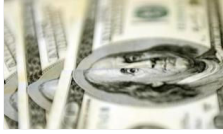
Dolar ve Avro ne kadar oldu?