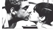
Gezici Festival'de 'Özgür Sinema'

Ana Sayfa Kültür-Sanat 2019 Göbeklitepe yılı