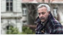
Onur ünlü: Büyük denilen filmler kof!