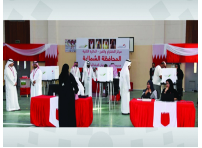
المرأة البحرينية الحاضر الأبرز في انتخابات 2018