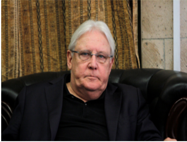
غريفيث يلتقي هادي ومسؤولي حكومته في الرياض