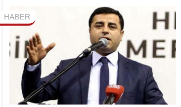
Selahattin Demirtaş'ın davası ertelendi