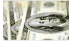
Dolar'da son durum

Ana Sayfa Türkiye 650 bin ağaç kesilmişti! Japonya, Sinop nükleer santralinden vazgeçiyor