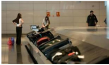
Ankara Esenboğa Havalimanı'nda hırsızlık operasyonu: 16 gözaltı