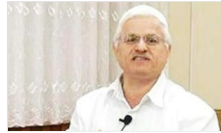
Atatürk'e ve Zübeyde Hanım'a hakaret etmiş! O dava görüntü