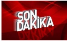
İstanbul'da FETÖ operasyonu: 41 asker için gözaltı kararı