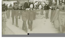
'Holokost'un izleri İstanbul'da...