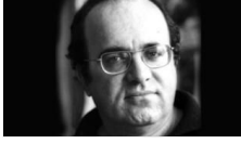
Uğur Mumcu Maltepe ve Kadıköy'de anılacak

Yazarlar Gündem Siyaset Türkiye Yerel Yönetim Dünya Ekonomi Kültür Çizerler Spor Yaşam Teknoloji Eğitim Sağlık Fotoğraf Video