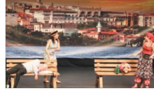
"Aziz Nesin Vapuru" Büyükçekmece'deydi...