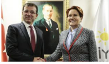
Ekrem İmamoğlu'ndan Meral Akşener'e ziyaret

Yazarlar Gündem Siyaset Türkiye Yerel Yönetim Dünya Ekonomi Kültür Çizerler Spor Yaşam Teknoloji Eğitim Sağlık Fotoğraf Video