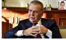
Kocaoğlu: Partimi bırakmam!