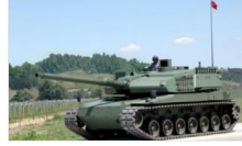
CHP'den Tank Palet Fabrikası'na ilişkin araştırma talebi