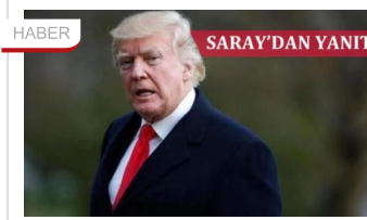
Trump'tan Türkiye'ye tehdit