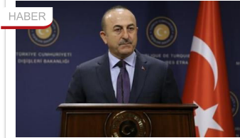
Ankara'dan Trump'a yanıt: 'Stratejik ortaklar sosyal medya üzerinden konuşmaz'