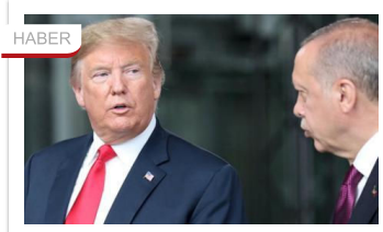
Erdoğan, Trump ile görüştü