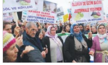
'Hayır demek geleceğe borcumuz'