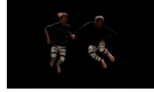
Rus Avangardı eserler SSM'de yorumlanacak