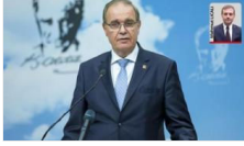
50 isim için gözler Kılıçdaroğlu'nda

Yazarlar Gündem Siyaset Türkiye Yerel Yönetim Dünya Ekonomi Kültür Çizerler Spor Yaşam Teknoloji Eğitim Sağlık Fotoğraf Video