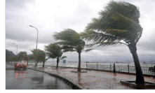
Meteorolojiden fırtına uyarısı