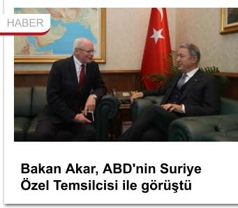
Bakan Akar, ABD'nin Suriye Özel Temsilcisi ile görüştü

Jeffrey'in bugün ise Dışişleri Bakan Yardımcısı Sedat Önal ile görüşeceği öğrenildi. Önal'ın Jeffrey'i Ankara'ya geldiği gün kabul etmeyerek bir gün beklettikten sonra görüşecek olması da ABD'ye diplomatik yoldan tepki bildirme olarak yorumlanıyor.