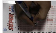
Süper Loto'da 19 milyon devretti