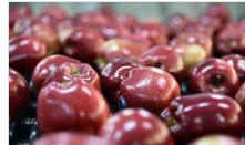
Elma pazarlığında kan aktı: 1 yaralı