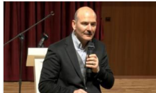
Soylu: Ankara Büyükşehir'e Kılıçdaroğlu'nun