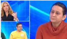
Kocasını tandırda yakıp programa katıldı