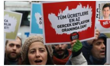
Enflasyon emekçiyi çarptı: İşte oluşan yeni tablo