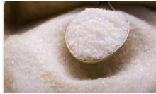
Şeker kotaları belirlendi