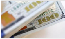
Piyasalarda son durum