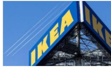
Ikea, mobilya kiralama hizmeti başlatmayı planlıyor