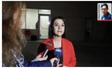
Taşcier: Polatlı'da 5 değil 10 asker yaralı