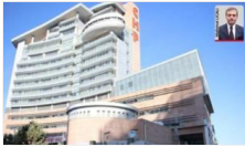
23 Şubat'taki PM 'kadük' kaldı