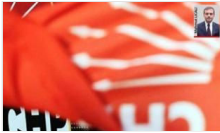
Kritik kentlere özel ekip