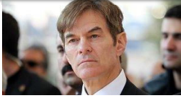
Mehmet Öz'ün acı günü