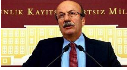
Mehmet Bekaroğlu'dan Soylu'ya sert sözler: Allah belanı versin