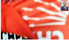
Kritik kentlere özel ekip