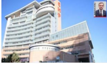
23 Şubat'taki PM 'kadük' kaldı