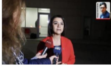
Taşcier: Polatlı'da 5 değil 10 asker yaralı