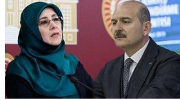
Hüda Kaya'dan Süleyman Soylu'ya hodri meydan!