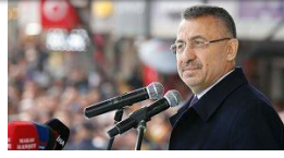
Cumhurbaşkanı Yardımcısı: Millîyetimizi patlıcanla, soğanla, biberle liderinin...