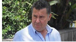
Bodrum Belediye Başkanı Mehmet Kocadon'un yeni partisi belli oldu