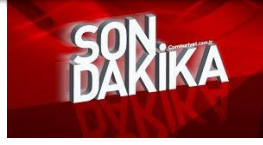
Flaş gelişme... AKP adayını geri çekti