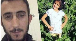
Eylül'ün katil zanlısından pes dedirten savunma