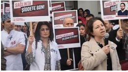
2 aydır tehdit ediyorlardı: Saldırganı kim koruyor?