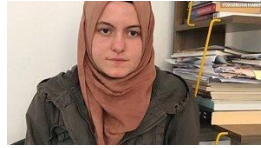
Utanc polise aittir