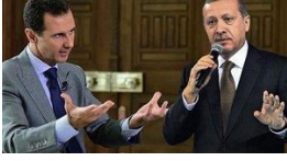
Esad'dan Erdoğan'a: Amerikalılar için küçük bir paralı asker