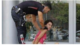
Bu görüntüsü şaşırtmıştı! Yeniden gözaltında...