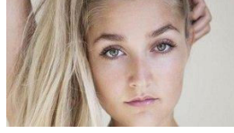
İngiltere: Festivalde uyuşturucu verdiği sevgilisi ölen adam, suçlu bulundu