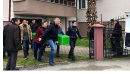
Polis memuru evinde ölü bulundu