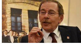
Abdüllatif Şener: Yeni parti konusunda Gül ile Davutoğlu anlaşmadı