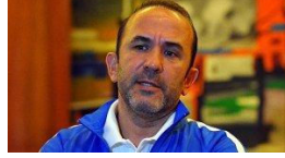
Mehmet Özdilek'ten Beşiktaş açıklaması!