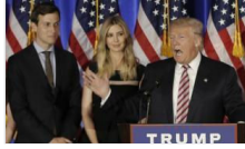
Trump'a ve yakınlarına "adaleti engelleme" soruşturması