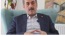
CHP ve HDP'nin desteklediği Saadet Partisi adayından açıklama