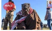
ABD Fırat'ı bırakmıyor