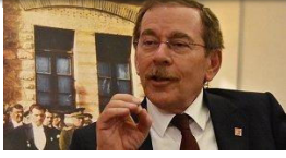
Abdülattif Şener: Yeni parti konusunda Gül ile Davutoğlu anlaşmadı