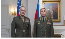
ABD-Rusya Genelkurmay Başkanları 'Suriye'de