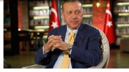
Erdoğan reytinglerde çakıldı