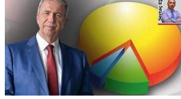
10 MHP seçmeninden 7'si... Cumhur'u sarsan oran