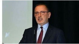
Fatih Altaylı yoğun bakımda!