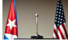
ABD'den Küba'ya yeni ticari ambargo kararı

Ana Sayfa Dünya Hulusi Akar'dan kritik ABD açıklaması: Muhataplarımız da kabul etti