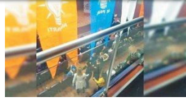
Okulda AKP propagandası Meclis'e taşındı