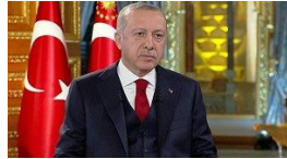
CANLI | Erdoğan: 'Endişeliyim, korkuyorum'