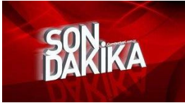
SON DAKİKA | Dev seyahat firması iflas etti