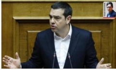
Yunanistan'la yeni gerilim