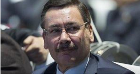
Gökçek'ten Erdoğan'ı kızdıracak paylaşım