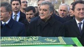
'Yeni Bir Parti'den kafa karıştıran paylaşım: Kapatıyoruz