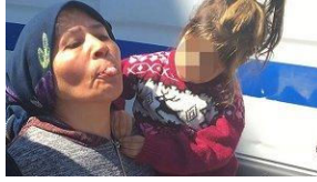
Dil çıkardı, tutuklandı... Çocuğu yakınlarına verildi