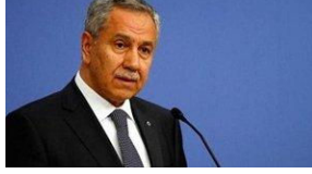
Bülent Arınç'tan kritik 'yeni parti' açıklaması