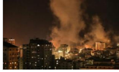
Hamas: Gazze'de ateşkes sağlandı

Ana Sayfa Dünya AB'den açıklama: Türkiye'ye 1.5 milyar Avro aktaracağız