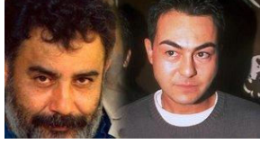
Ahmet Kaya'nın abisi: Eğer kardeşim yaşasaydı Serdar'ı...