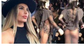
Hatice'nin gözyaşlarına boğuldu: Sizin ananız bacınız...