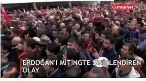
Erdoğan'ı mitingte sınırlandıran olay