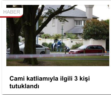
Cami katliamıyla ilgili 3 kişi tutuklandı