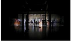
Venezüella'da elektrik yeniden kesildi