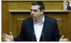
Yunanistan'la yeni gerilim