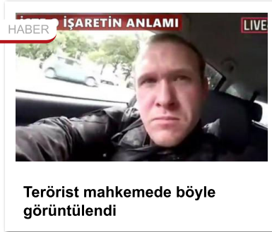
Terörist mahkemede böyle görüntülendi