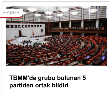
TBMM'de grubu bulunan 5 partiden ortak bildiri