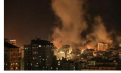
Hamis: Gazze'de ateşkes sağlandı

Ana Sayfa Dünya Yeni Zelanda'dan Erdoğan'a bir tepki daha