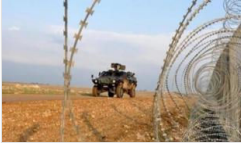
ABD'den 'güvenli bölge' açıklaması