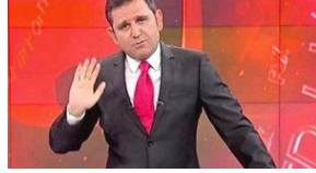
Fatih Portakal sosyal medyadan duyurdu: Bir araştırma oranı geldi...