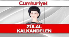
Venezüella'da sınıf temelli muhalefet