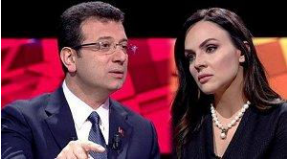
Ekrem İmamoğlu'ndan Buket Aydın açıklaması