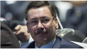
Gökçek'ten Erdoğan'ı kızdıracak paylaşım