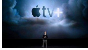
Yeni Apple TV neler getiriyor?