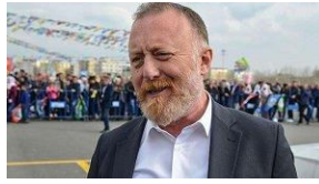
Temelli'den "Kürt bile değil" diyen Erdoğan'a yanıt