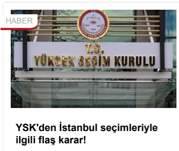
YSK'den İstanbul seçimleriyle ilgili flaş karar!