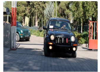
دبي - "الحياة" //www.alhayat.com/ )