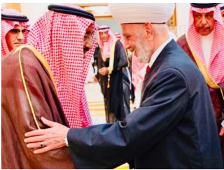
بيروت - "الحياة" //www.alhayat.com/ )