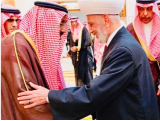
الملك سلمان التقى دريان في