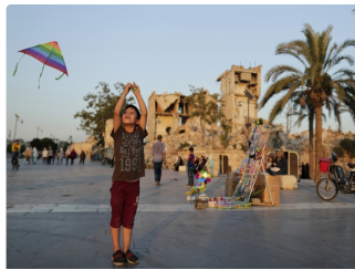
بيروت - أ ف ب- //www.alhayat.com/ )