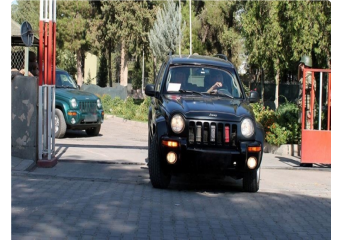
وفد أميركي يواصل في تركيا ترتيبات