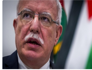
فلسطين تحض على تنفيذ