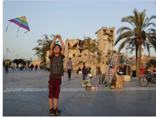
59 قتيلاً في اشتباكات بين قوات