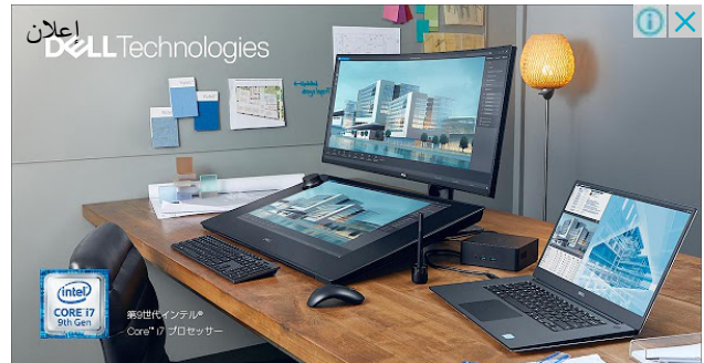
クリエイターの創造性を解き放つ