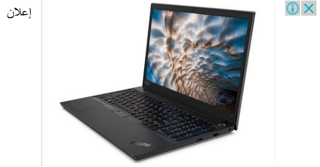
【43%OFF】Lenovo ThinkPad E15 Win10...