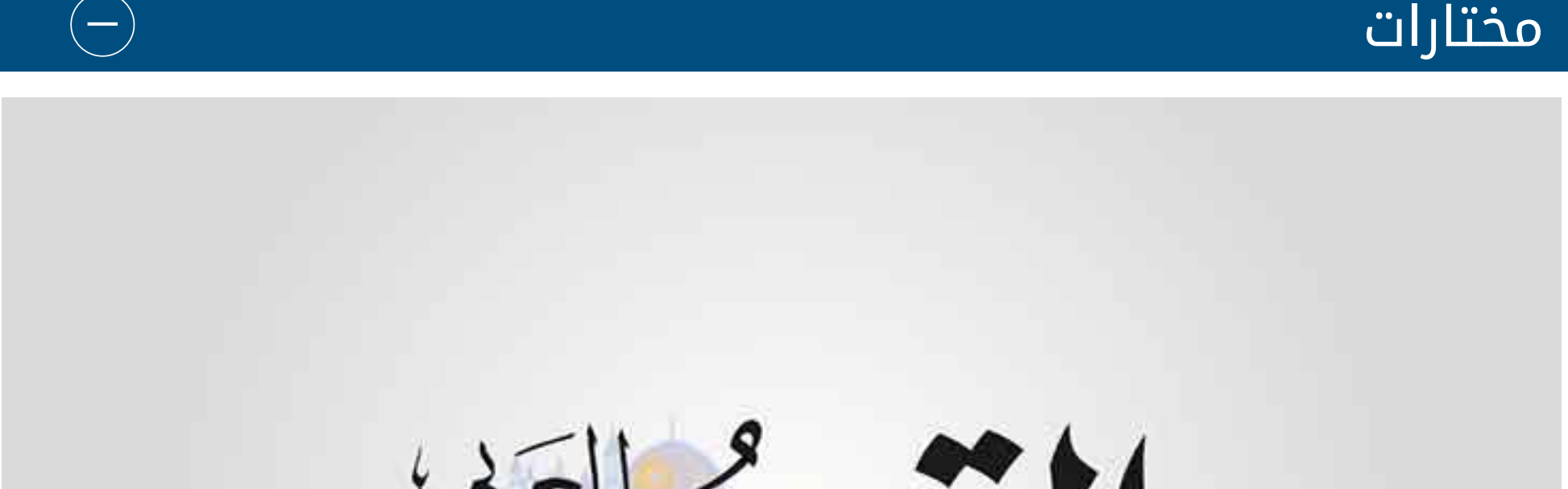
جماعة الحوثي تشكر سلطنة عُمان على تقديمها مساعدات طبية لليمن - (تغريدة)