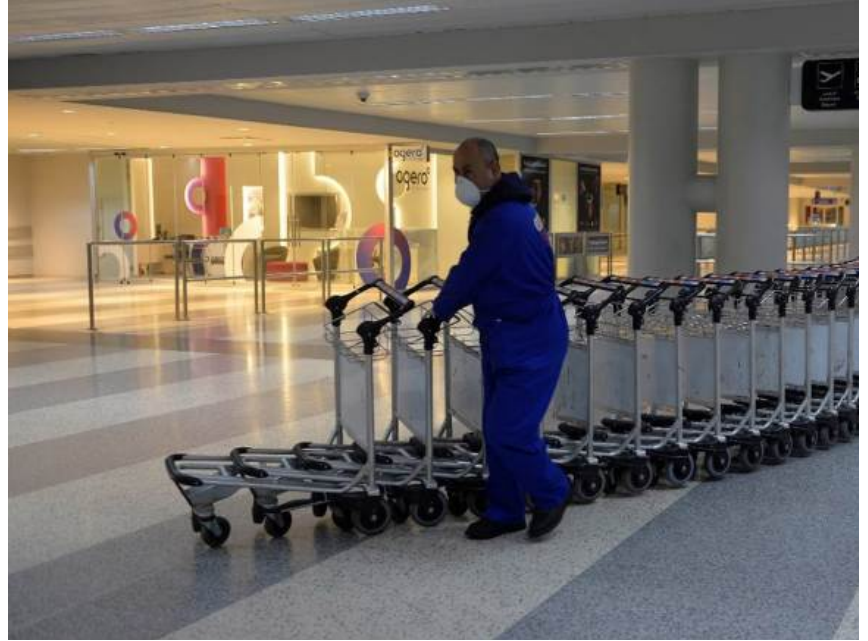
ركات الطيران في المنطقة العربية (علي علوش)

ت الجوية من المنطقة العربية وإليها وداخلها في عام 2020 للانخفاض إلى حوالي 154 مليون مسافر، يات العام 2009.