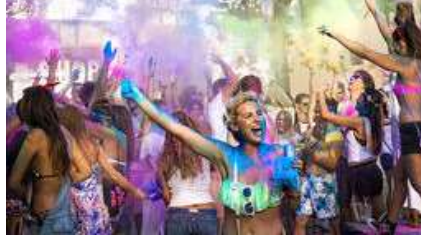
İspanya'nın eğlence adası İbiza