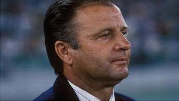
Fenerbahçe'nin eski hocası hayatını kaybetti