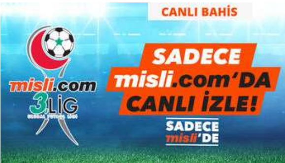
Misli.com 3. Lig Canlı Yayınları