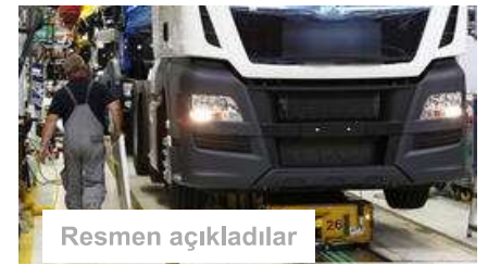
Dev Őirket binlerce kiři iřten çıkaracak!