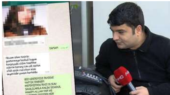
Medyumlarından pes dedirten istismar! 'Büyük yapıp kargoyl...