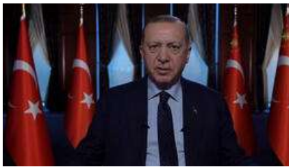
Erdoęan'dan net mesaj: 'Artık dur...