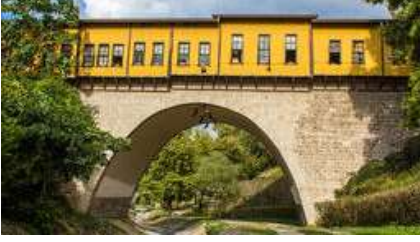
Dünyanın en ünlü çarřılı köprüleri