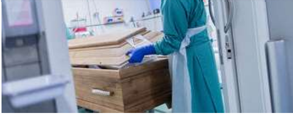
Almanya'da 982 ölüm daha

Son Dakika Gündem Ekonomi Dünya Yazarlar UzmanPara Skorer Pembena Cadde