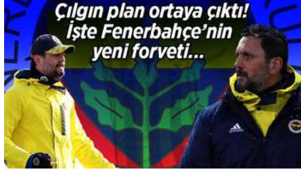
F.Bahçe'nin yeni forvet arayıřında mutlu son