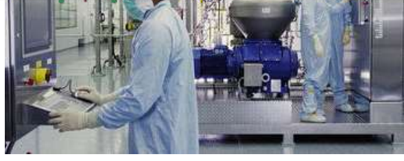
Antikor ilaçları koronavirüs ile mücadelede umut veriyor