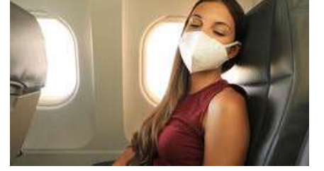
Salgın döneminde uçuşlarda dijital...