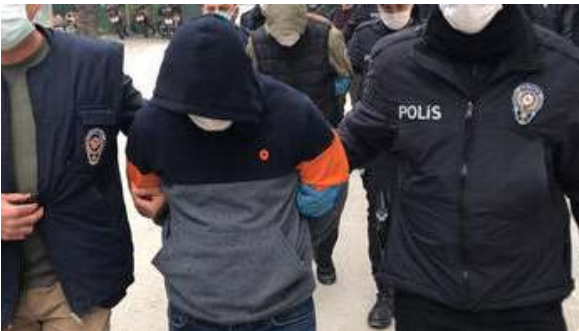
Tam 2 milyon 700 bin lira! 'Büyük paraydı, olmadı'