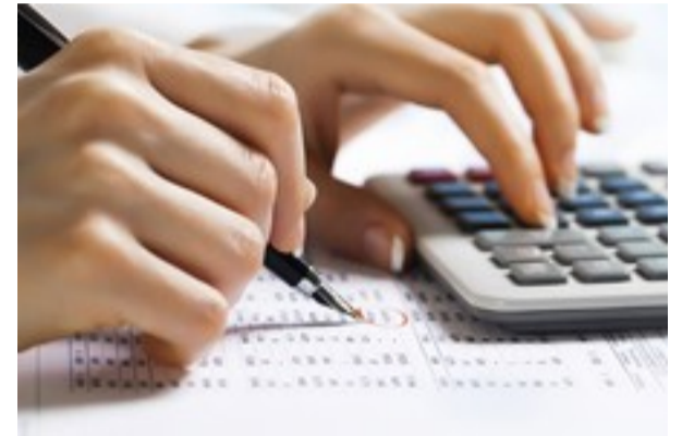
حسابدارید؟ همکاران سیستم برای تان پیشنهاد ویژه ای دارد