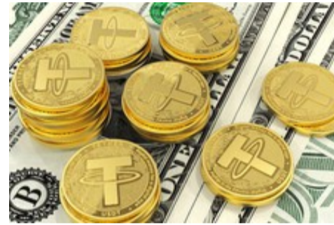
آموزش رایگان خرید قانونی تتر (دلار دیجیتال)!