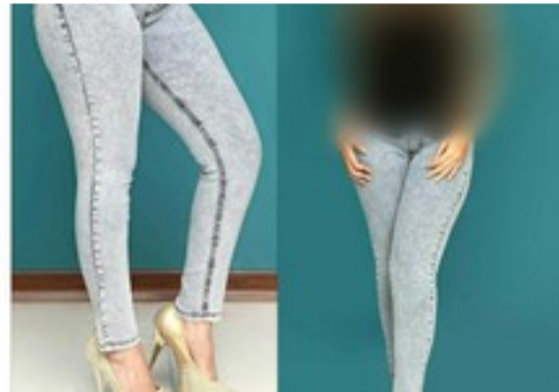
خرید شلوار لی زارا فرصت محدود + ارسال رایگان !!