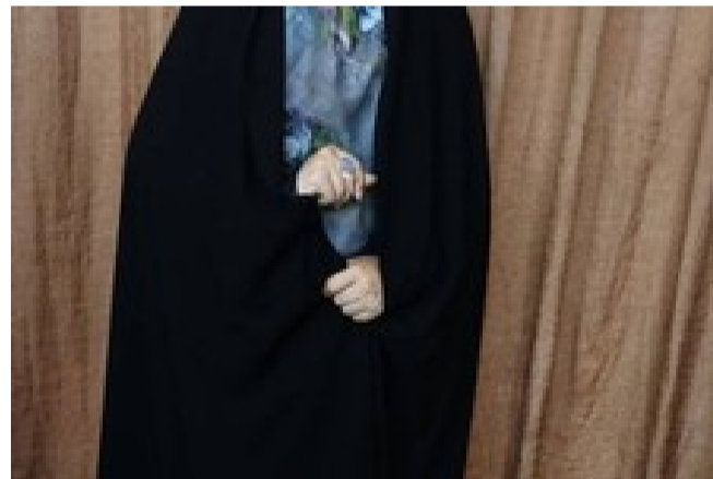
خرید چادر ساده ایرانی دوخته شده فقط امروز + ارسال رایگان !!