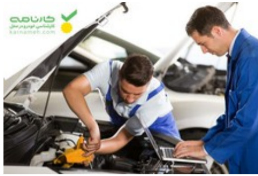
ماشین رو کارشناسیش کن بعد با خیال راحت بخر!!