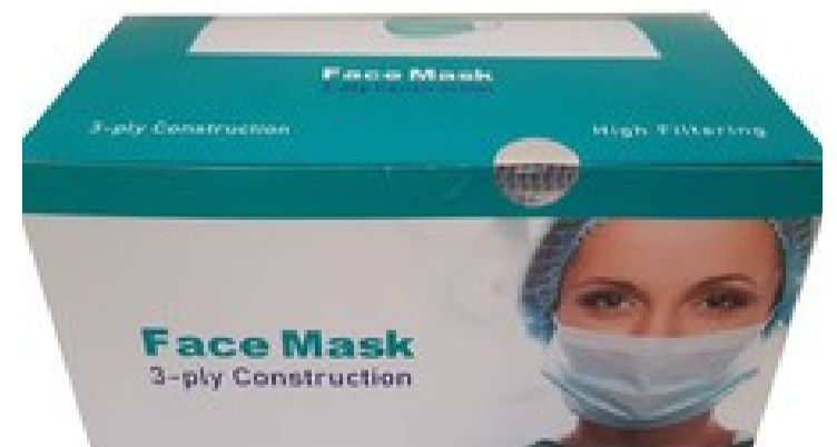
بسته 1+50 عددی ماسک تنفسی پزشکی سه لایه با بهترین قیمت بازار