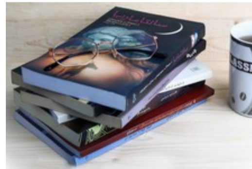
محبوبترین کتابهای جهان رو از گاج مارکت بخر!