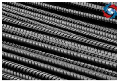
شوک ناگهانی افزایش قیمت میلگرد