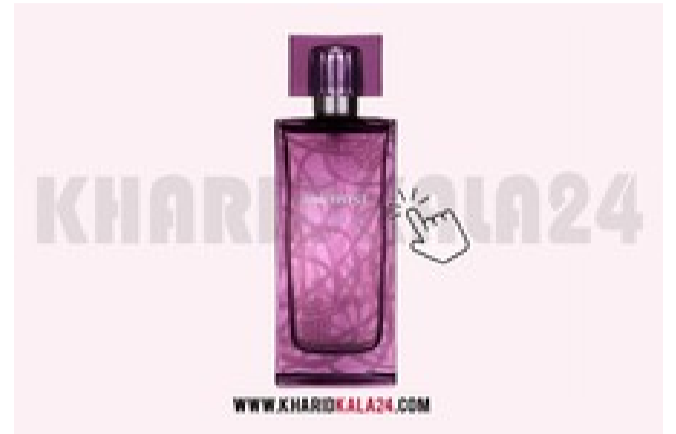
بذار بوی عطرت همه جا بپیچه! بهترین قیمت عطرهاى زمستانى