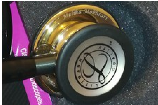
لیتمن مشکی شامپاینی رو تخفیف ویژه شب یلدا بخر! 😄 😄 😄