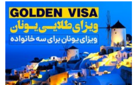
اقامت سه خانواده با خرید یک ملک !!!