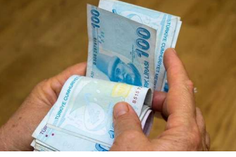
Son dakika: Çifte ödeme yapılacak...