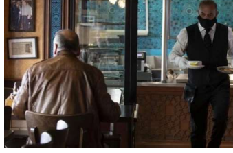
Son Dakika: Market, fırın ve...