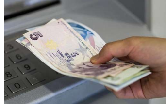
Son dakika: Meclis'e geliyor!...