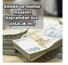
Emekli maaşları bayramdan önce...