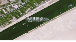
Süveyş Kanalı'nı tıkadı

Rus işletmecisi açıklamasına göre Orta Asya Türk Cumhuriyetleri Türkiye'nin en önemli ihracat rotalarından birisi. 2020 yılında Türkiye ile Orta Asya cumhuriyetleri arasında ticari hacim 31 milyar dolar gerçekleşti. Rusya'daki nehir kanalları üzerinden ulaştırılacak yüklerin daha ucuza taşınacağı gibi bürokrasiyi de azaltmış olacak.