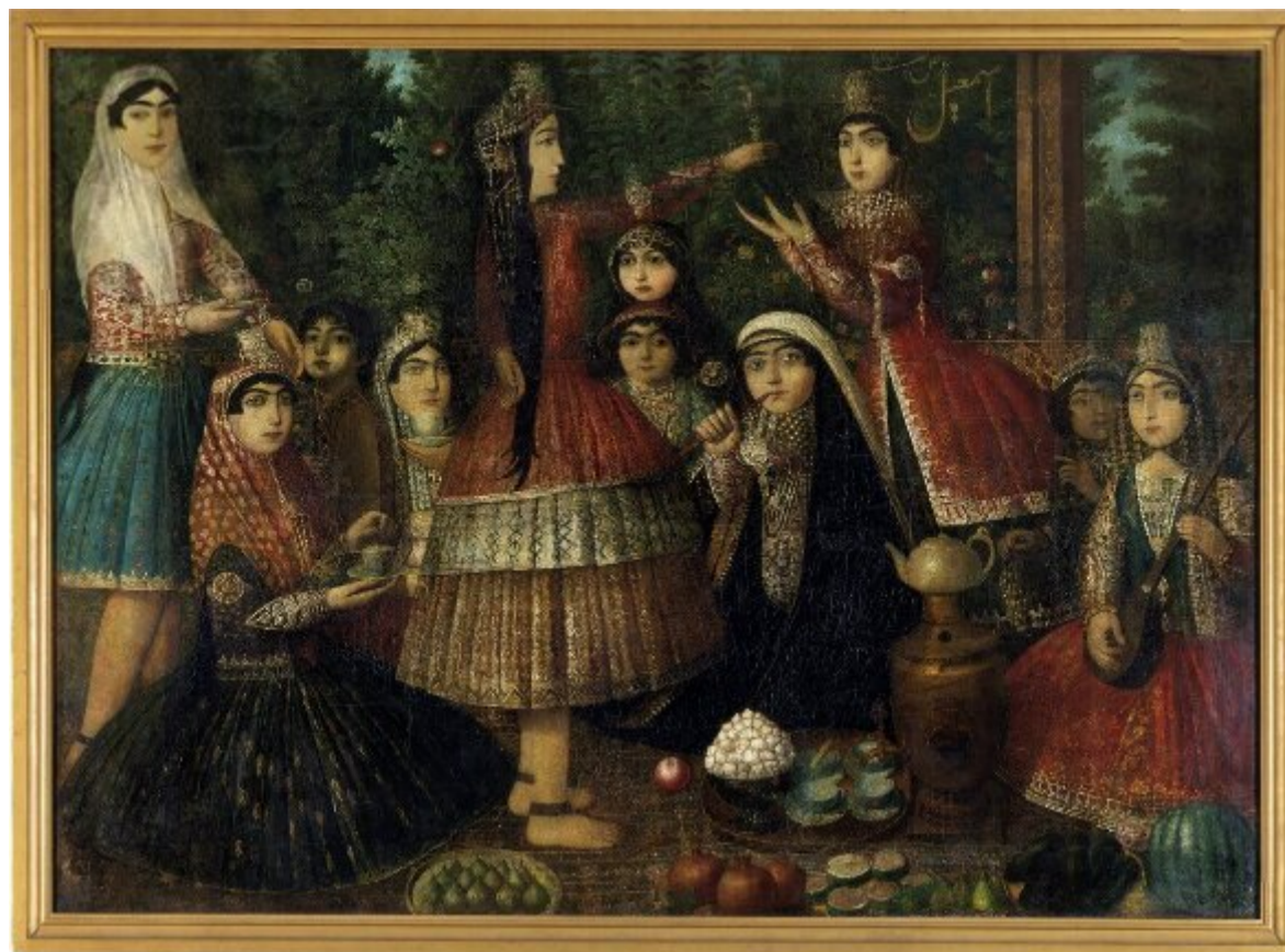
«زنان در اطراف سماور» (۷۵ - ۱۸۵۰) نقاشی اسماعیل جلاپیر از زنان حرمسرا که احتمال داده می‌شود متعلق به دوره ناصرالدین شاه بوده باشد و احتمالاً هم این نقاشی را از روی عکس کشیده است. این اثر نیز در موزه ویکتوریا و آلبرت لندن نگهداری می‌شود.