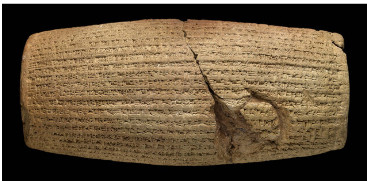
منشور کوروش که در موزه بریتانیا نگهداری می‌شود و برای نمایش در «ایران حماسی» به موزه ویکتوریا و آلبرت امانت داده شده

در «ایران حماسی»، امپراطوری پارس با تمرکز بر هخامنشیان، یک بخش مجزا به خود اختصاص داده و در آن ارابه‌های طلائی، تندیس‌ها و نقش برجسته‌هایی از شاهان و سربازان، ریتون‌ها و جام‌های زرین و سیمین به نمایش گذاشته شده است. منشور حقوق بشر کوروش نیز از موزه بریتانیا مهمان این نمایشگاه شده و به عنوان شاهکاری شاخص معرفی شده است. روزنامه گاردین با تفسیری از شکوه این دوران نوشته که «امپراتوری پارس، زندگی تشریفاتی با شکوه و جلالی را نمایش می‌دهد...» و بعد با شرح جزئیات نقش برجسته‌ای که از موزه فیتز ویلیام کمبریج به امانت گرفته شده، به ظرافت هنری آن دوران اشاره می‌کند و در ادامه به مخاطبان پیشنهاد می‌دهد که برای آنکه بدانند امپراطوری پارس از نگاه خارجی‌ها چگونه بود و اسکندر با آن چه کرده؛ تاریخ هردوت مورخ یونان باستان را بخوانند.