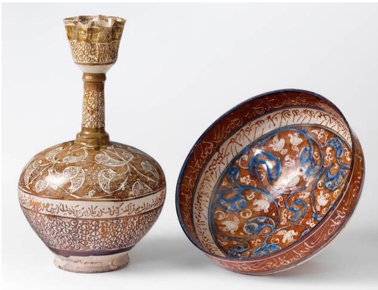
بطری و کاسه‌ای مزین به شعر فارسی متعلق به ۱۱۸۰ - ۱۲۲۰ میلادی که در موزه ویکتوریا و آلبرت لندن نگهداری می‌شود.