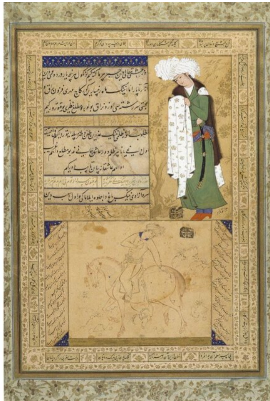
یک نسخه دست‌نویسی شده متعلق به قرن هفدهم میلادی با نقشی از یک شکارچی سوار و جوانی ایستاده با لباس‌هایی فاخر به همراه اشعاری به زبان فارسی که در اطراف صفحه شعرهایی از سعدی مشاهده می‌شود. این نسخه هم‌اینک در موزه ویکتوریا و آلبرت لندن نگهداری می‌شود.