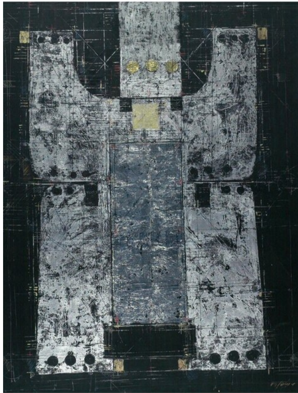
فروهر، اثری از مسعود عربشاهی که در بخش معاصر «ایران حماسی» نمایش داده شده