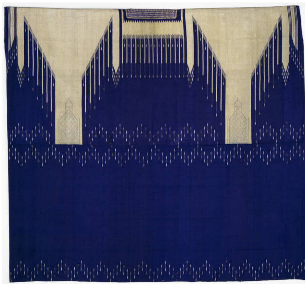
ابا، روپوش مردانه متعلق به قبل از ۱۸۷۷ میلادی از کاشان که در موزه ویکتوریا و آلبرت لندن نگهداری می‌شود. این نمایشگاه تا ۱۲ سپتامبر (شهریورماه) در لندن برپاست.