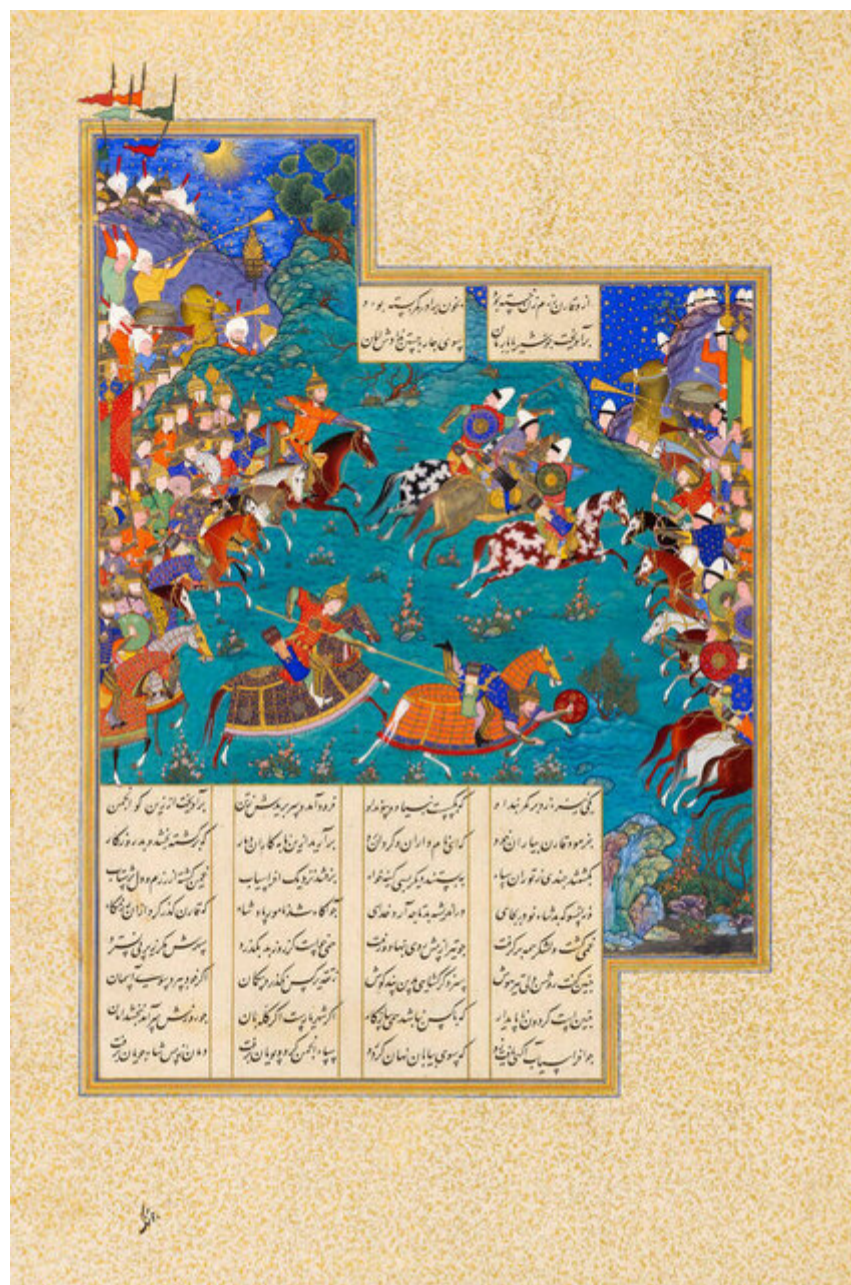
برگی از شاهنامه شاه طهماسب. امانت گرفته شده از مجموعه ساریخانی

نمایشگاه اما بخش بزرگی را هم به هنر معاصر ایران اختصاص داده که مکتب‌های مختلفی در آن به نمایش درآمده که نیمی از آثار آن، به زنان هنرمند ایرانی اختصاص دارد.