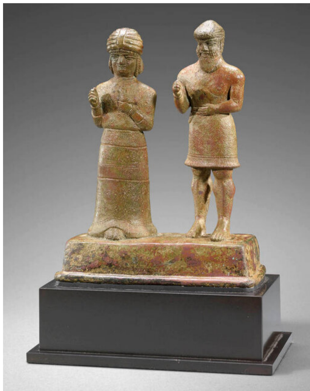
این ریخته‌گری باشکوه برنزی به دوران ایلام میانه (۱۵۰۰ تا ۱۱۰۰ قبل از میلاد) مربوط است. زوجی که روی یک ازاره ایستاده‌اند و لباس‌های فاخری پوشیده‌اند، که احتمالاً پادشاه و ملکه باشند. حالت آن‌ها نشان می‌دهد که عبادت می‌کنند. این پیکرک‌های کوچک احتمالاً از کاوش‌های فرانسوی‌ها در شوش بدست آمده‌اند که اکنون از مجموعه ساریخانی برای این نمایشگاه به امانت گرفته شده است.