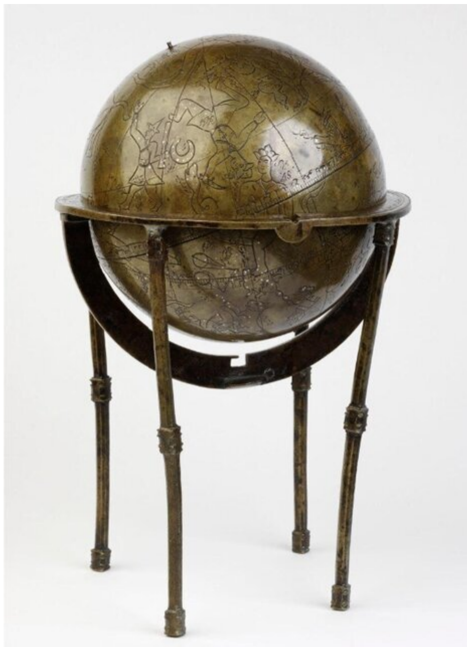
کره آسمانی متعلق به قرن هفدهم میلادی، صورت‌های فلکی که در آسمان دیده می‌شود، روی این کره نقش بسته است. این کره در زمان خود ابزار نجومی بود که برای طالع‌بینی مخصوصاً در حکومت سلطنتی استفاده می‌شد.