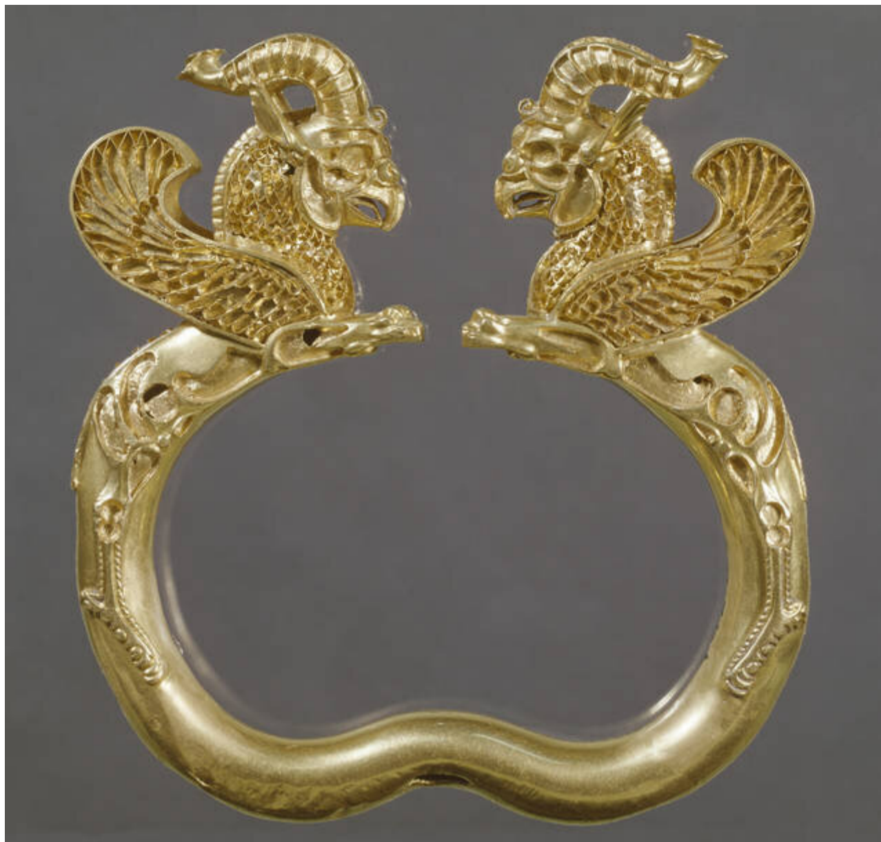
بازوبند طلائی متعلق به ۵۰۰ تا ۳۳۰ قبل از میلاد که پس از چند بار خرید و فروش و سرقت، سرانجام به دست موزه ویکتوریا و آلبرت رسیده است.

در «ایران حماسی»، امپراطوری پارس با تمرکز بر هخامنشیان، یک بخش مجزا به خود اختصاص داده و در آن ارابه‌های طلائی، تندیس‌ها و نقش برجسته‌هایی از شاهان و سربازان، ریتون‌ها و جام‌های زرین و سیمین به نمایش گذاشته شده است. منشور حقوق بشر کوروش نیز از موزه بریتانیا مهمان این نمایشگاه شده و به عنوان شاهکاری شاخص معرفی شده است. روزنامه گاردین با تفسیری از شکوه این دوران نوشته که «امپراتوری پارس، زندگی تشریفاتی با شکوه و جلالی را نمایش می‌دهد...» و بعد با شرح جزئیات نقش برجسته‌ای که از موزه فیتز ویلیام کمبریج به امانت گرفته شده، به ظرافت هنری آن دوران اشاره می‌کند و در ادامه به مخاطبان پیشنهاد می‌دهد که برای آنکه بدانند امپراطوری پارس از نگاه خارجی‌ها چگونه بود و اسکندر با آن چه کرده؛ تاریخ هردوت مورخ یونان باستان را بخوانند.