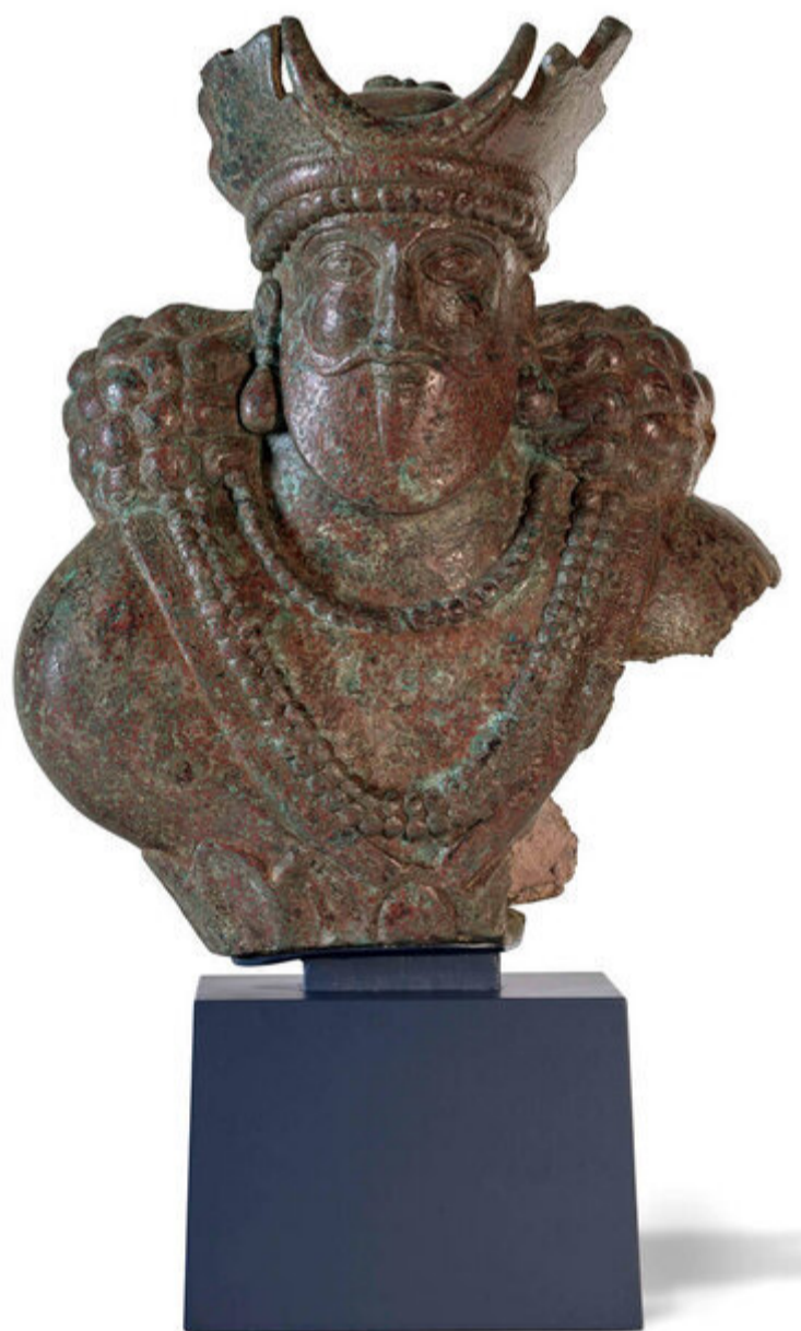
نیم‌تنه سلطنتی با دوره تاریخی در حدود ۴۳۹ - ۴۵۷ میلادی که از مجموعه ساریخانی برای این نمایشگاه امانت گرفته شده است.