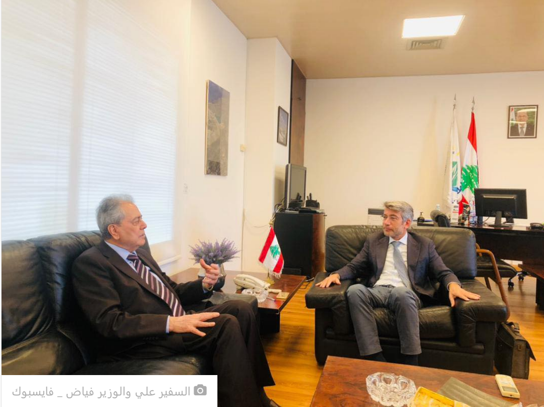
السفير علي والوزير فياض