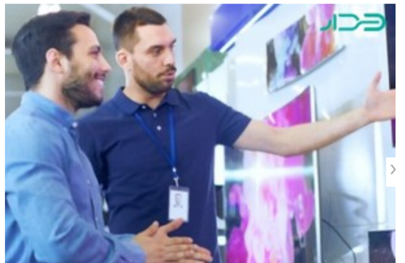
چجوری به مشتری قیمت بدیم که از خرید منصرف نشه؟ این راهنما رو بخون!