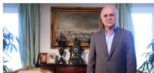
عزیزی خادم باید نظر اسکوچیچ را و تو می‌کرد