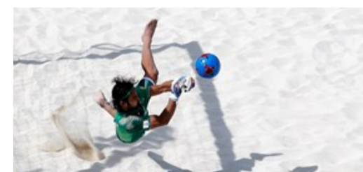
محبوبیتم را با هیچ مقامی عوض نمی‌کنم