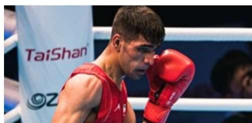
برای موفقیت در بوکس باید در حد مرگ بجنگی