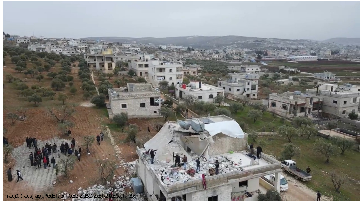
مكان الشهادة زعيم تنظيم داعش في اطمه بريف إدلب

أثار مقتل زعيم تنظيم “الدولة الإسلامية” أبو إبراهيم القرشي (عبد الله قرداش)، في محافظة إدلب شمال غربي سورية، ردود أفعال من ناشطين سوريين، خاصة أنه الزعيم الثاني للتنظيم الذي يقتل في المحافظة.