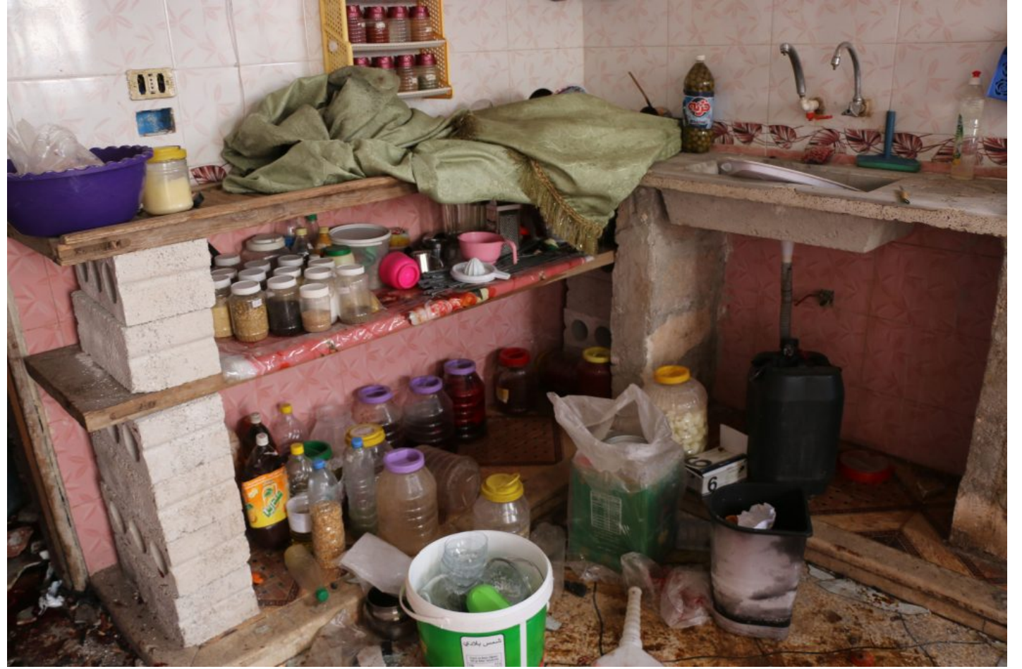
مطبخ الطابق الأول للمبنى المستهدف