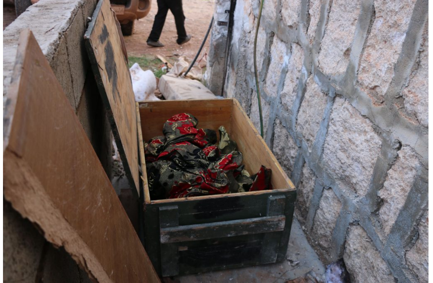
صندوق الأحمدة الناسفة التي عثر عليها داخل المبنى

لكن الرواية الرسمية الأمريكية، تقول إن قرداش هو من فجّر نفسه، وذلك ورد على لسان جوزيف بايدن، الذي قال اليوم الخميس: "قرر تفجير نفسه في الطابق الثالث بعد اقتراب قواتنا من المبنى".