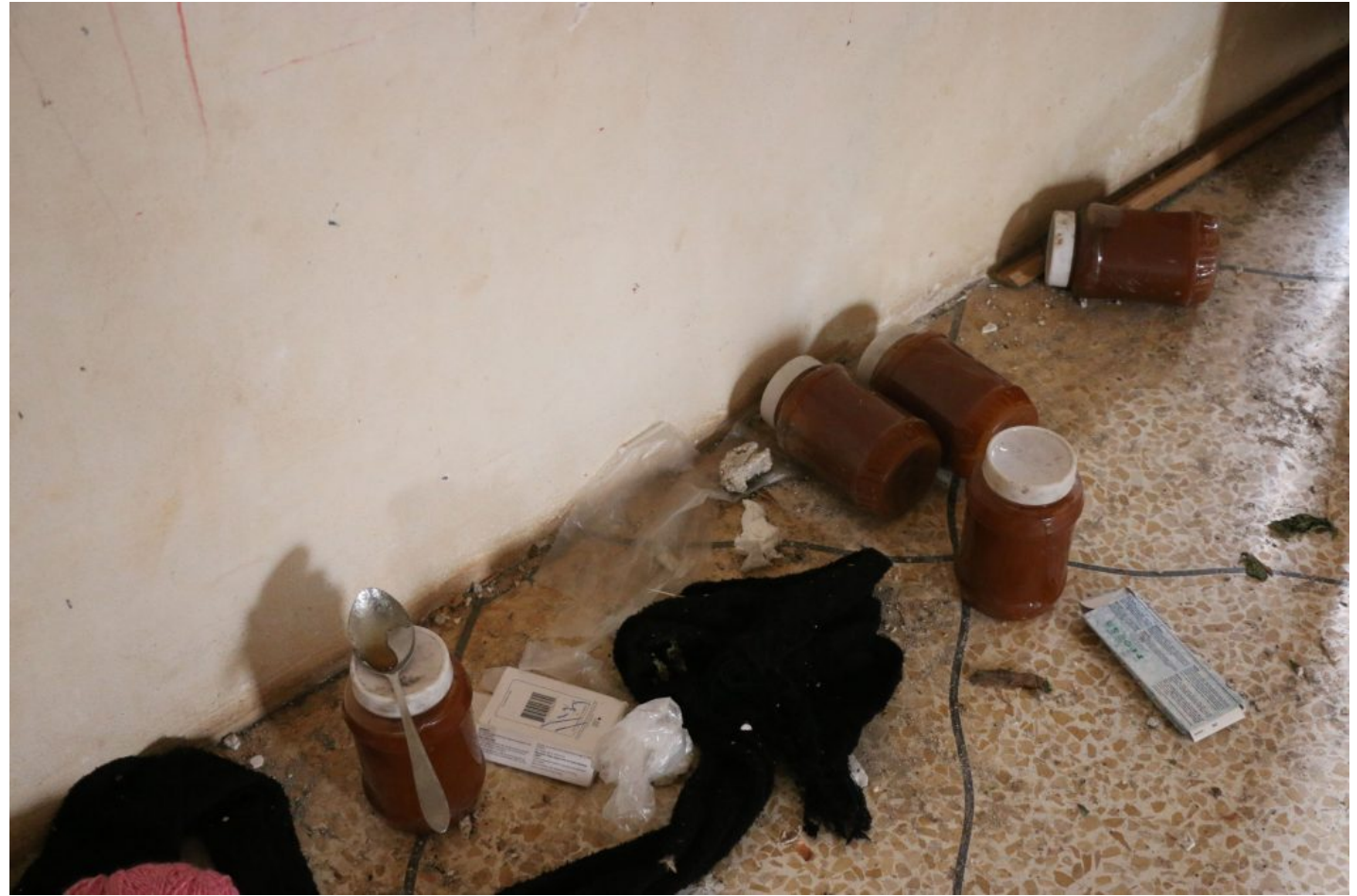
مواد غذائية وأوعية غسل ومُربى في المبنى المستهدف (السورية.نت)