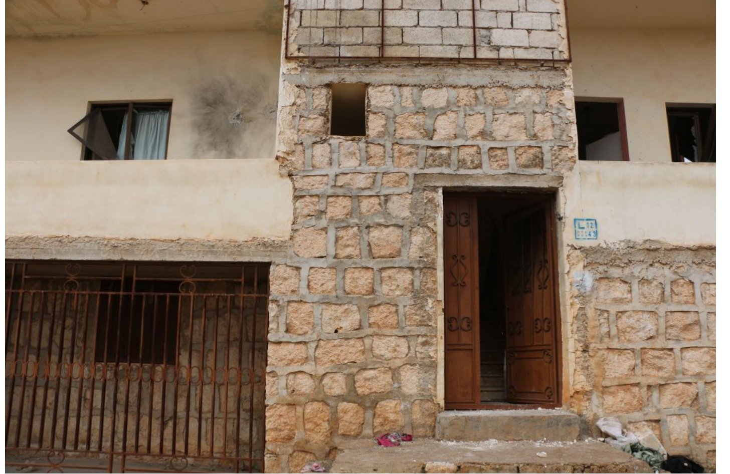
المبنى الذي تحصّن فيه زعيم تنظيم "داعش" خلال هجوم التحالف، بلدة أطمه، 3 فبراير/شباط 2022