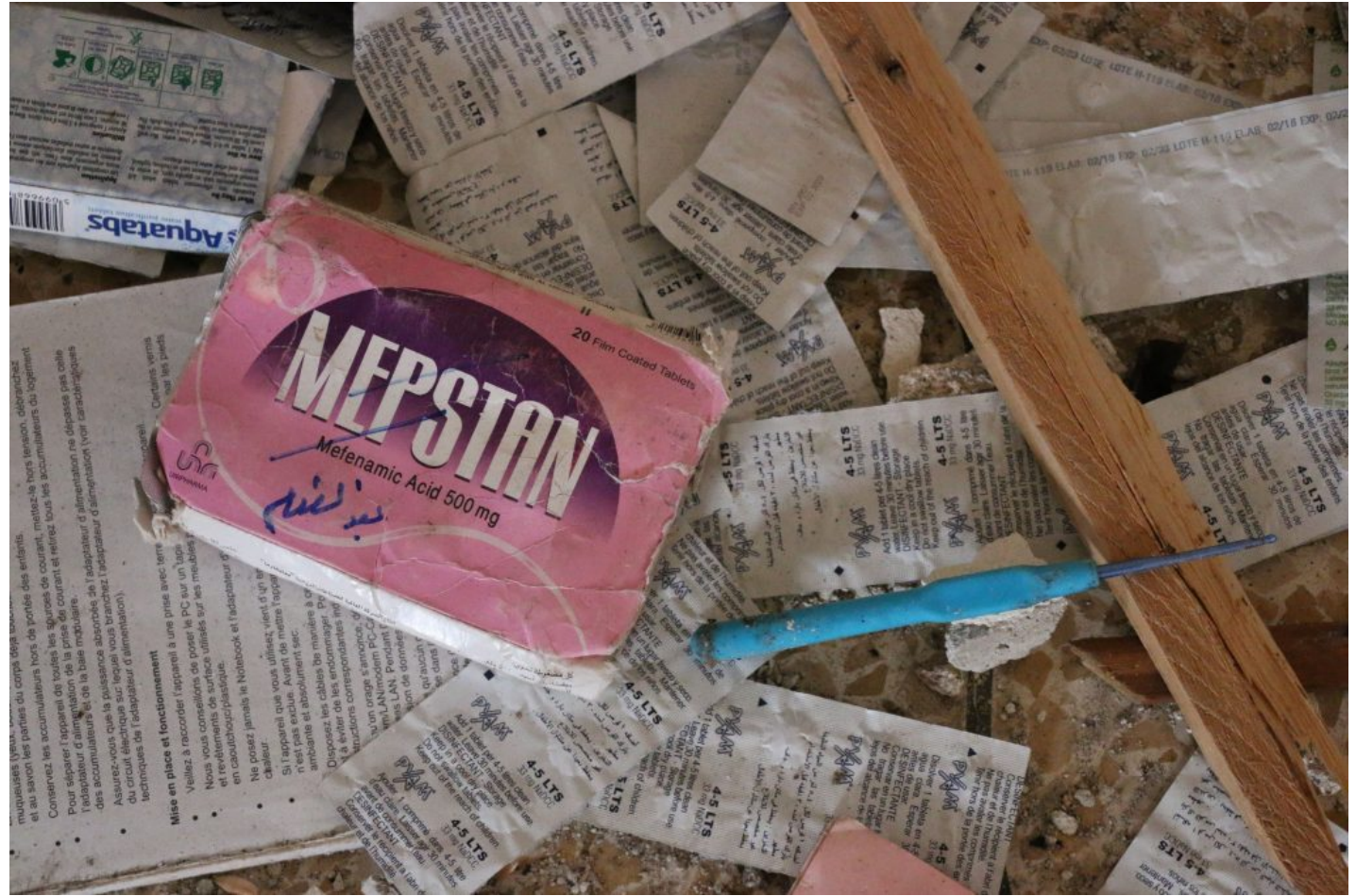
من موجودات المبنى المستهدف