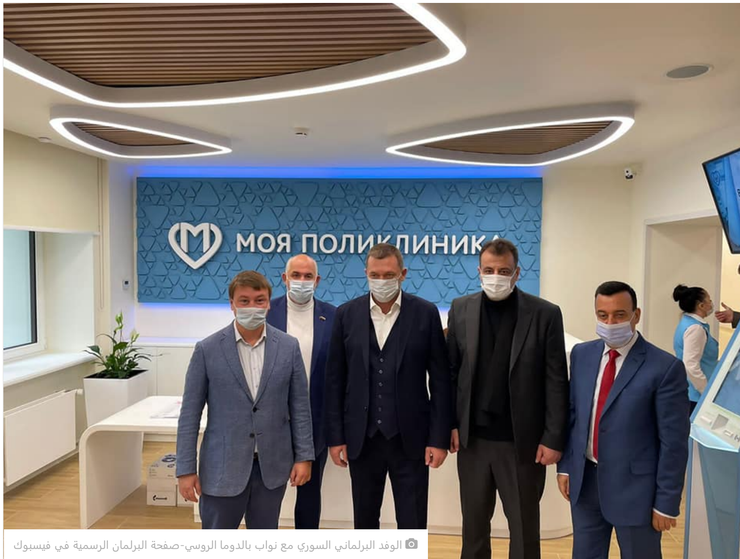
الوفد البرلماني السوري مع نواب بالدوما الروسي-صفحة البرلمان الرسمية في فيسبوك