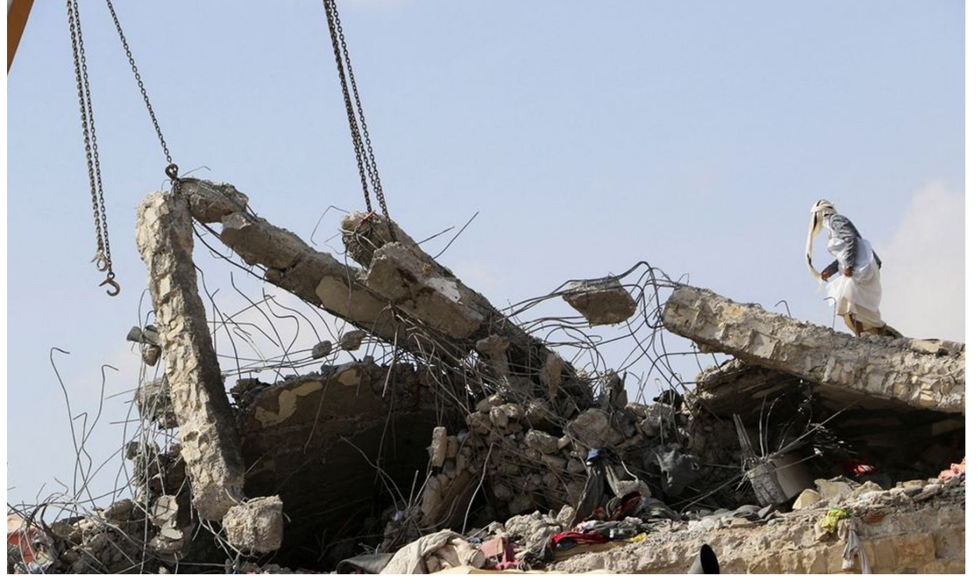
رجل يسير على سطح منهار لمركز احتجاز أصيب بضربات جوية في صعدة اليمنية- 21 من كانون الثاني 2022