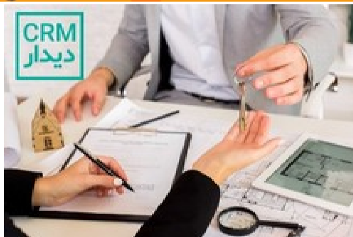
نرم افزار CRM ابری دیدار، راهکاری موثر و مطمئن برای مشاوران املاک