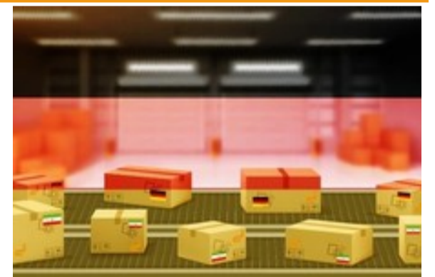
واردات انواع کالا با پایین ترین نرخ از آلمان | تی اکسپرس