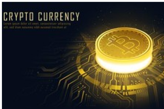
با ربات تحلیلگر، ارزهای دیجیتال پرسود را شکار کن! (تست رایگان)