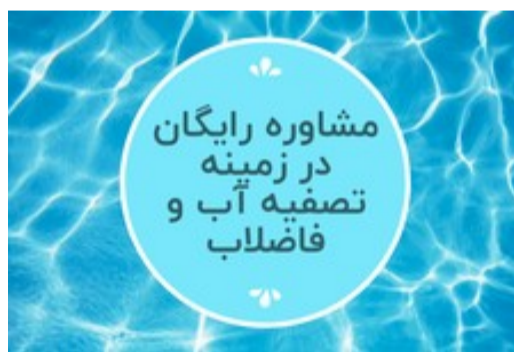
مشاوره رایگان در زمینه انواع تصفیه آب و فاضلاب