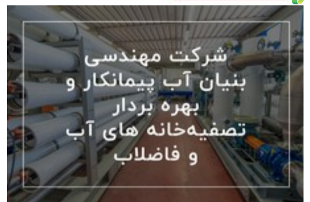
شرکت بنیان آب، راه حل تمام مشکلات آب و فاضلاب شما