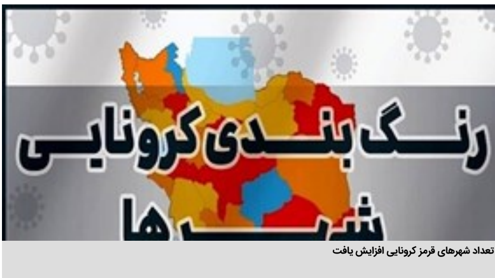
تعداد شهرهای قرمز کرونایی افزایش یافت