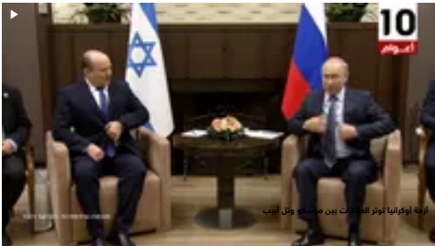
أزمة أوكرانيا تؤثر العلاقات بين موسكو واث إيب