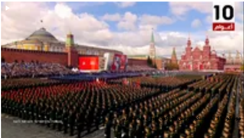
يوم الأحد 10 سبتمبر، تشارك في العرض العسكري