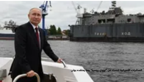
المخابرات الأميركية تتحدث عن "نوعي روسيا" وما يعتقد بوتين