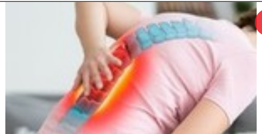
در یک ساعت کمردرد خود را درمان کنید! «بدون نیاز به دکتر و دارو»