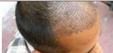
یه روزه مو بکار؛ قسطی پرداخت کن (فقط امروز)