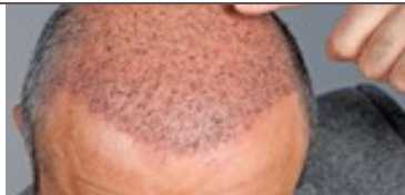
کاشت موی قسطی با تخفیف 3 میلیون تومانی