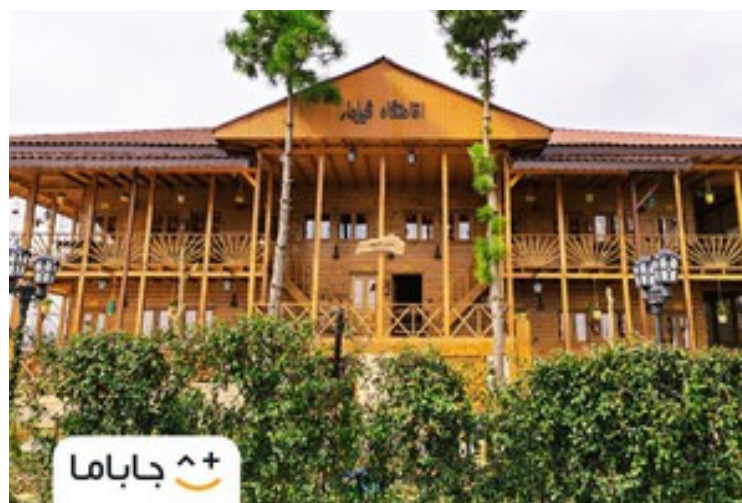
رشت شلوغه؟ برو تو روستاهش! اجاره بومگردی‌های باقیمت عالی | جاباما