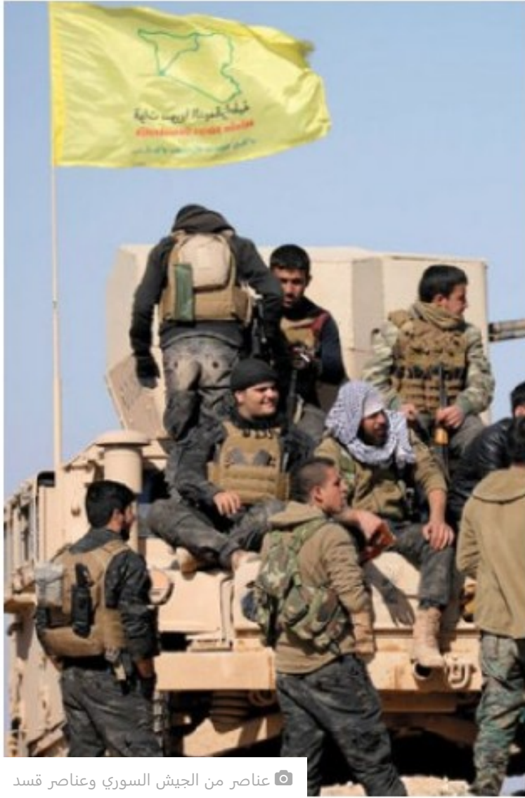
عناصر من الجيش السوري وعناصر قسد