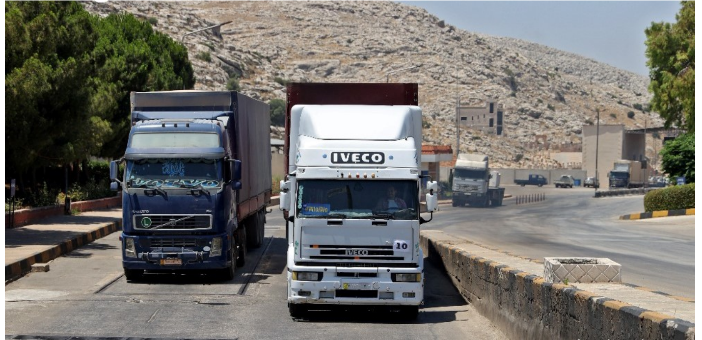
المدنيون قد يجرموا من المساعدات الإنسانية الحيوية في غضون أسابيع

ينتهي اليوم الأحد، سريان آلية نقل المساعدات الإنسانية عبر "باب الهوى" على الحدود السورية التركية، المعبر الوحيد الذي يمكن عبره نقل مساعدات إلى مناطق سيطرة الفصائل المعارضة في شمال غرب سورية، من دون المرور في مناطق سيطرة نظام الأسد.