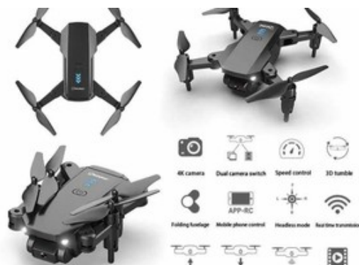
انواع گجت های کاربردی خودرو ، سفر و زندگی روزمره