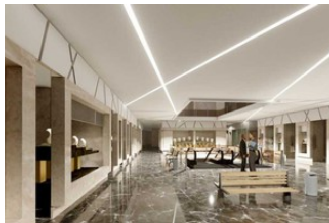
مشاوره رایگان سرمایه گذاری ملکی- تجاری در مرکز طلا و جواهر