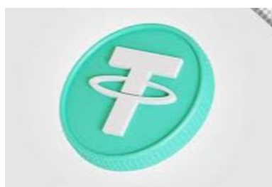
دریافت ارزی دیجیتال رایگان از بیت‌پین