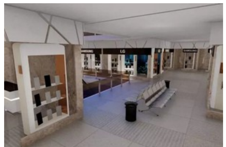
با کمترین سرمایه، بروی مرکز خرید موبایل و کامپیوتر سرمایه گذاری کنید