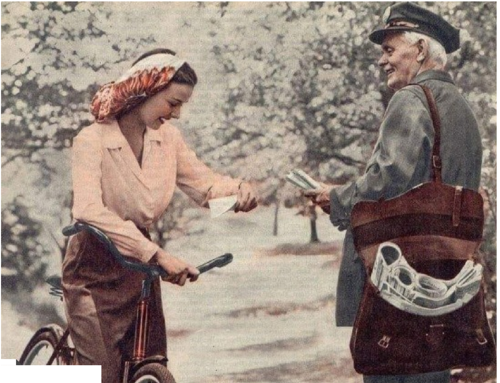
ركوب الدراجات قديما